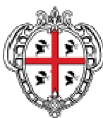
TAV. I -Elenco toponomastico del centro storico di Nule come risulta dalle fonti.